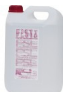
HAZE PLUS cod.R0016

Quando la macchina è in funzione, il corpo riscaldante raggiunge elevate temperature e necessita di un'ora per il raffreddamento. Pertanto, attendere più di 60 minuti prima di procedere alla manutenzione.